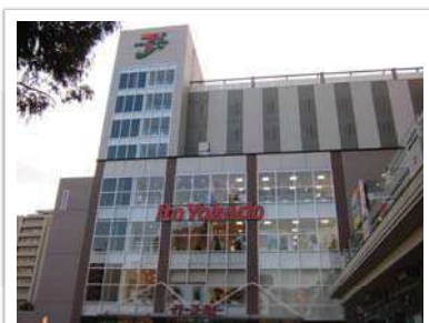
イトーヨーカドー