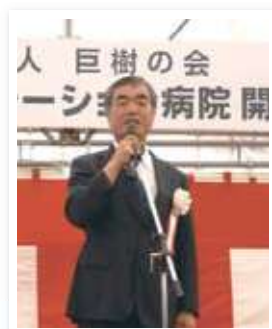
小金井リハビリテーション病院 リハビリテーション科