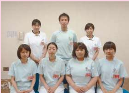
■ 小金井リハビリテーション病院 医療連携室 TEL 042-316-3100(直通)